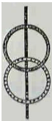
Non dupes errant 14 a : noeud bo avec droite, la forme la plus simple du noeud borroméen.

J'ai cru pouvoir, pouvoir à ce moment vous le montrer au tableau d'une façon qui était évidemment aventurée, puisque, comme vous avez pu le voir et à ma grande exaspération, j'y ai pataugé, n'est-ce pas. J'y ai pataugé parce que chose curieuse, il y a en somme, c'est cela que cette expérience signifie, il y a quelque chose de... de pas encore maîtrisé dans, vous le savez, je vous l'ai indiqué, je vous le rappelle, de non encore maîtrisé dans ce qui est de l'ordre des noeuds. C'est étrange, c'est singulier, quoique déjà quelque chose a bien pu en être avancé, que le noeud borroméen ait été identifié à, à la tresse à six mouvements, six et pas trois, comme il semblerait pouvoir y paraître, c'est déjà quelque chose, et aujourd'hui ce que je vous montre... à mettre, à rapporter à ce que je vous avais déjà marqué, déjà écrit, déjà écrit, comme étant la forme la plus simple, la plus simple du noeud borroméen qui est très exactement celle-ci, c'est-à-dire celle où nulle part il n'y a un troisième rond, le troisième rond ici n'étant représenté que par une droite que vous me permettez de supposer infinie :